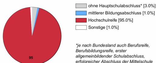
Ausbildungsanfänger/innen 2017 (in %)

Rechtlich ist keine bestimmte Schulbildung vorgeschrieben. In der Praxis stellen Betriebe überwiegend Auszubildende mit Hochschulreife ein.