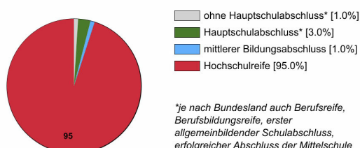
Ausbildungsanfänger/innen 2020 (in %)

Rechtlich ist keine bestimmte Schulbildung vorgeschrieben. In der Praxis stellen Betriebe überwiegend Auszubildende mit Hochschulreife ein.