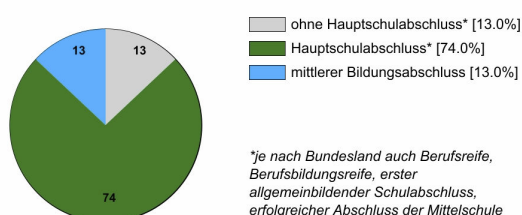
Ausbildungsanfänger/innen 2019 (in %)

Rechtlich ist keine bestimmte Schulbildung vorgeschrieben. In der Praxis stellen Betriebe überwiegend Auszubildende mit Hauptschulabschluss* ein.