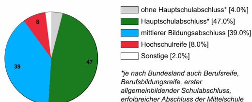
Ausbildungsanfänger/innen 2020 (in %)

Rechtlich ist keine bestimmte Schulbildung vorgeschrieben. In der Praxis stellen Betriebe überwiegend Auszubildende mit Hauptschulabschluss* oder mittlerem Bildungsabschluss ein.