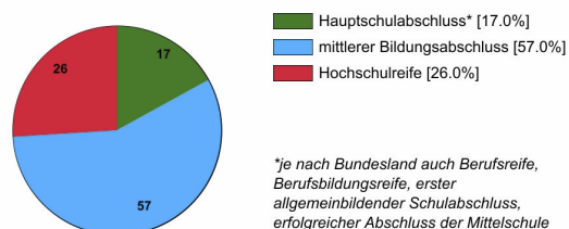
Ausbildungsbereich Industrie und Handel