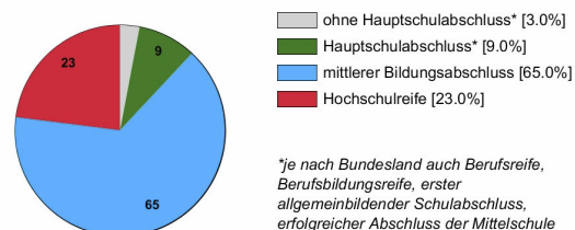
Ausbildungsbereich Industrie und Handel