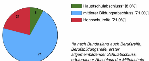
Ausbildungsbereich Industrie und Handel